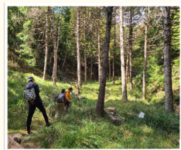
癒しウォーキング