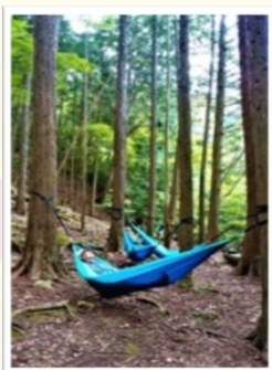
森のゆりかごハンモック体験