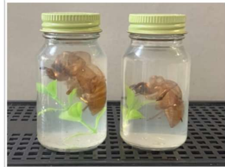
セミの抜け殻の標本作り