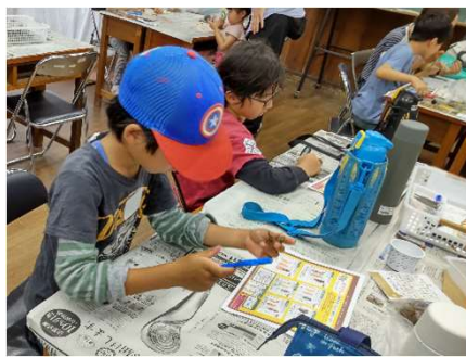
セミの抜け殻を観察