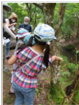
地図とヒントを持って動物探し