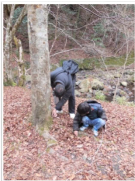
リスの貯食体験遊び

地図とヒントを持って隠れている動物を探したり、森遊びをしましょう。 工作はトンボのブローチをつくります。