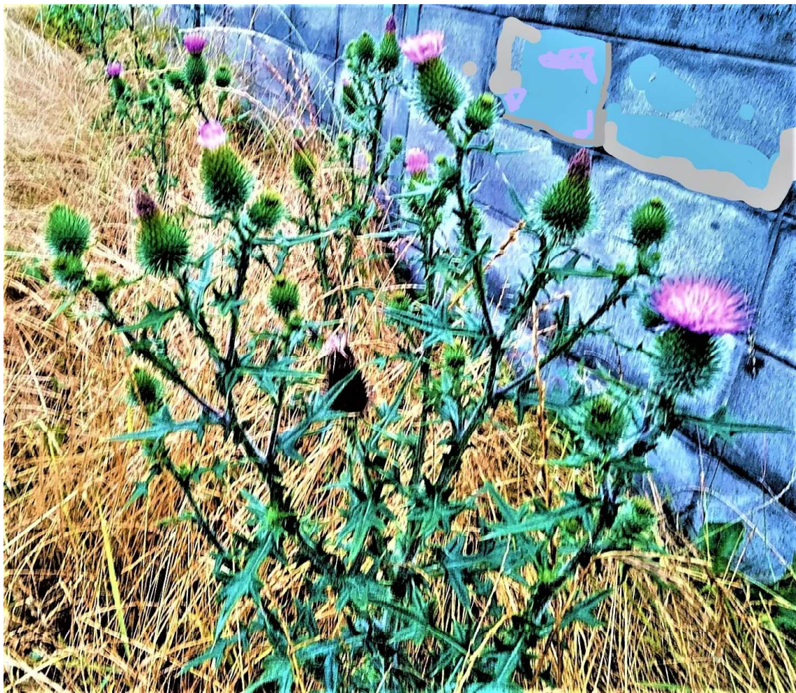
【アメリカ・オニアザミ】