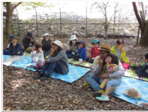
私は何の動物でしょう? わかったら鼻に指をあててね