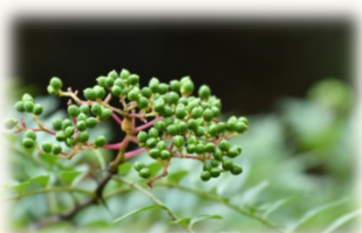
イヌザンショウの実