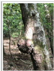
ロバに見える? 珍樹