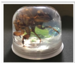
セミの抜け殻標本を作ろう