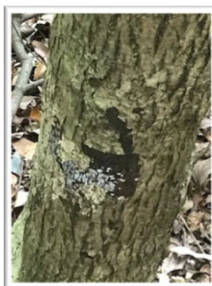
ご飯をかきこむ? 珍樹