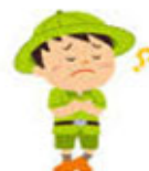
セミのクイズもやります