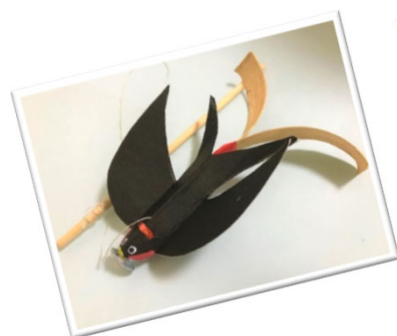
パタパタつばめを作り ましょう