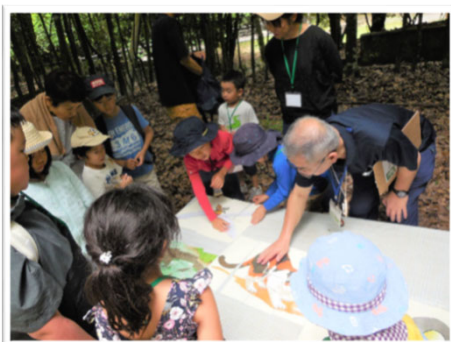
隠れている動物は何か?