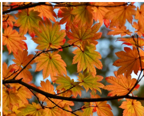
コハウチワカエデ