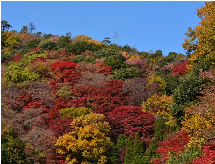
多様な樹種がつくる箕面の紅葉

秋の深まりとともに、落葉樹の紅葉が始まります。柔らかな日差しに照らされた紅葉は特別に美しいです。光の当たりやすいところから紅葉が進むので、1本の枝でも美しいグラデーションが見られます。紅葉といえば公園や街路樹で見かけるモミジやイチョウが思い浮かびますが、森の中では様々な木々が赤や黄色に変化します。