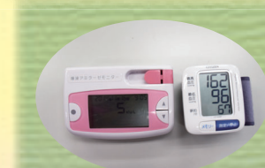
コンディション測定

森の中で本来の自分にもどってみませんか？ 森のセラピーロードで 「セラピーの様々なプログラム」を行うと 心と身体がリラックスできます。 森の癒しの効果が最大となるように セラピーアシスターがご案内します。