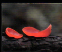
ベニチャワンタケ