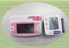
コンディション測定