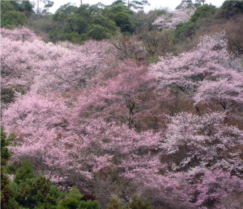
エドヒガンの群落 大日駐車場の周辺

ぽかぽか陽気に誘われて、たくさんの生き物たちが活動する季節です。桜から新緑の頃にかけて森はさまざまな表情を見せます。モミジが美しい季節というと紅葉の時期を思い浮かべるとはと思いますが、新緑の頃も格別です。モミジの木の下から空を見上げ光に葉を透かしてみてください。命の輝きを感じるはずですよ。