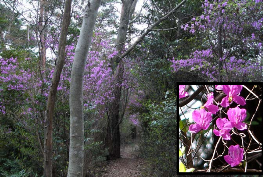
コバノミツバツツジ 4月初旬から 自然研究路3号線など