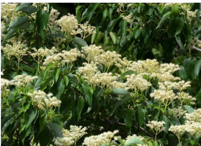
クマノミズキ 5月ごろ

箕面川ダム周辺の林道や散策路では、5月になると、上の写真の木々の花が、多彩な色で目を楽しませてくれます。