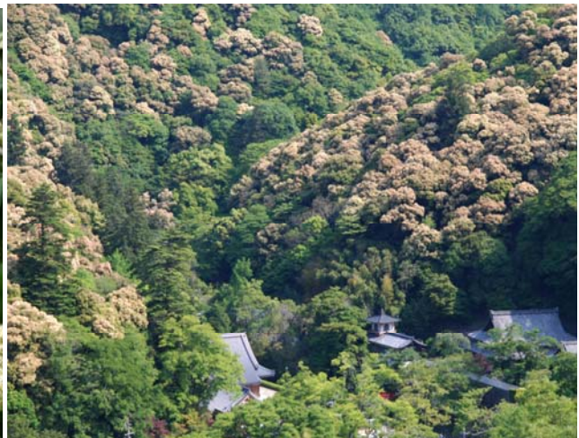
シイの花 5月初旬ごろから

箕面川ダム堰堤から長谷橋に向かう市道箕面五月山線の斜面でたくさんみることができます。