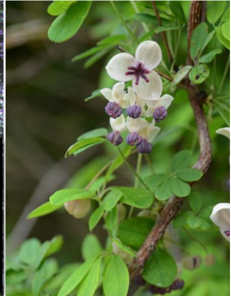
アケビ 4月初旬から 箕面川ダム林道など