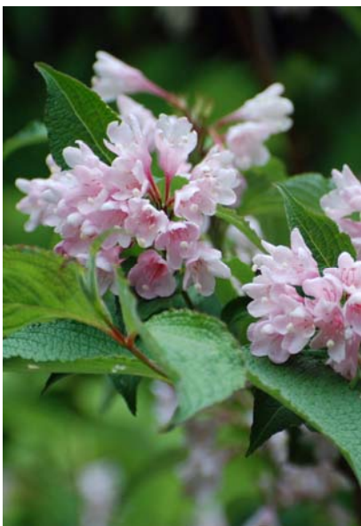
タニウツギ 5月初旬ごろから