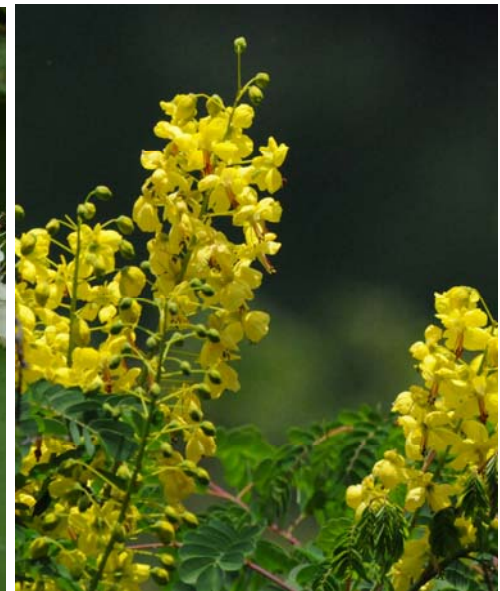
ジャケツイバラ 5月初旬ごろから

箕面川ダム周辺の林道や散策路では、5月になると、上の写真の木々の花が、多彩な色で目を楽しませてくれます。