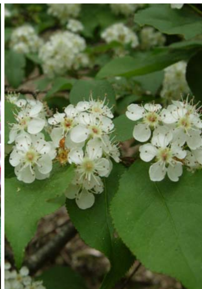
カマツカ 5月初旬ごろから