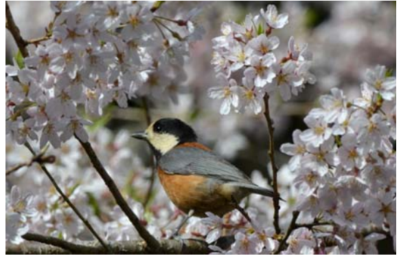
エドヒガンとヤマガラ