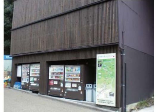
自然環境にあった落ち着いた外観