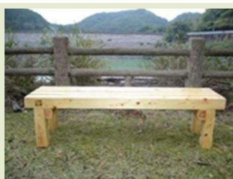
箕面川ダム 林道のベンチ

【箕面里山工房の活動日】 毎月第1・3土曜日9時～14時 勝尾寺園地内の作業場 その他、木製品の依頼など 活動に興味のある方は 連絡をお願いします。 TEL/072-729-5235