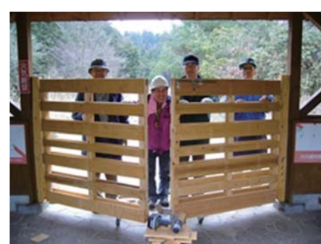
エキスポの森の鹿除けゲート