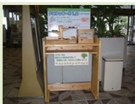
タッキー816のリクエスト台