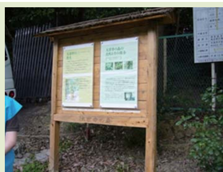
大宮寺の森の案内板