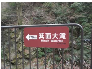
箕面大滝までの4箇所案内板を設置