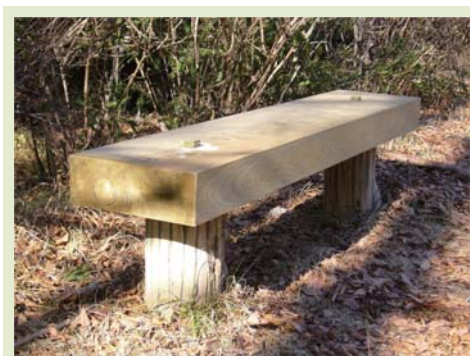
勝尾寺園地のベンチ修理