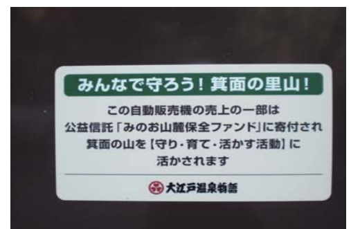
山麓ファンド募金付き自販機