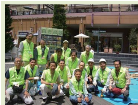
こどもの木工教室開催記念