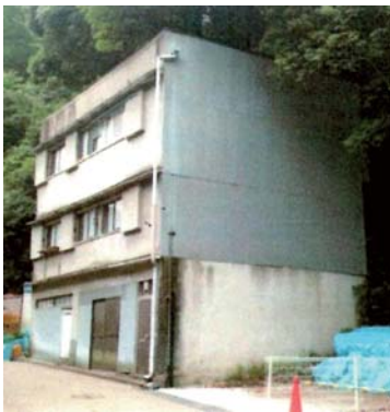
事業開始前の建物の外観