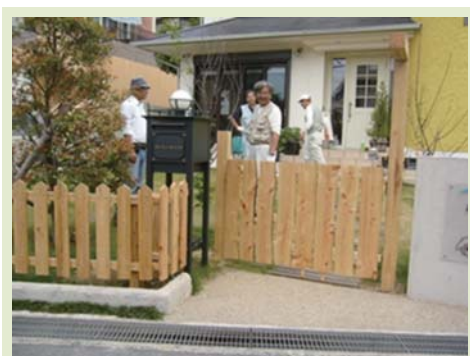
箕面市内・喫茶店の門塀