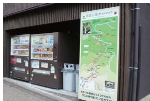
自動販売機と箕面公園案内地図