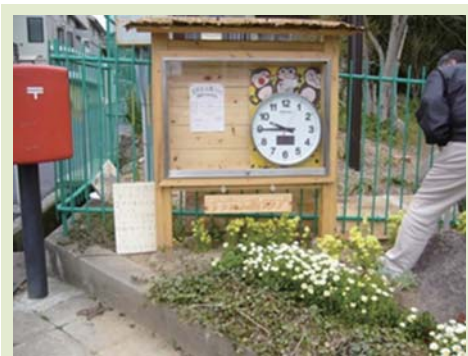
すずは公園クラブの時計箱