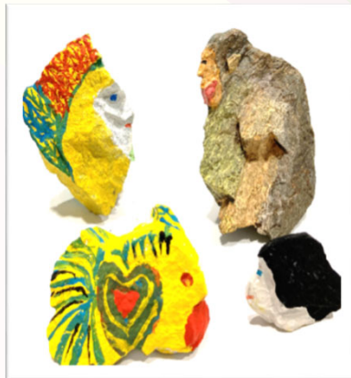
ストーンペインティングに挑戦 お気に入りの石を探しましょう