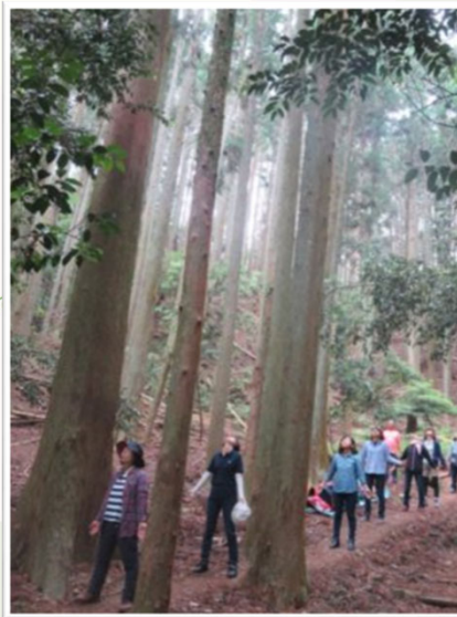
五感を使って自然を味わう