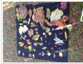
ジャンケンでたくさん葉っぱを 集めましょう