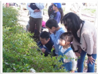
森の中に紛れ込んだ人工の物 を見つけね